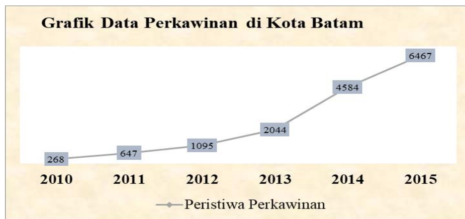
Gambar 1: Data Perkawinan di Kota Batam 2015