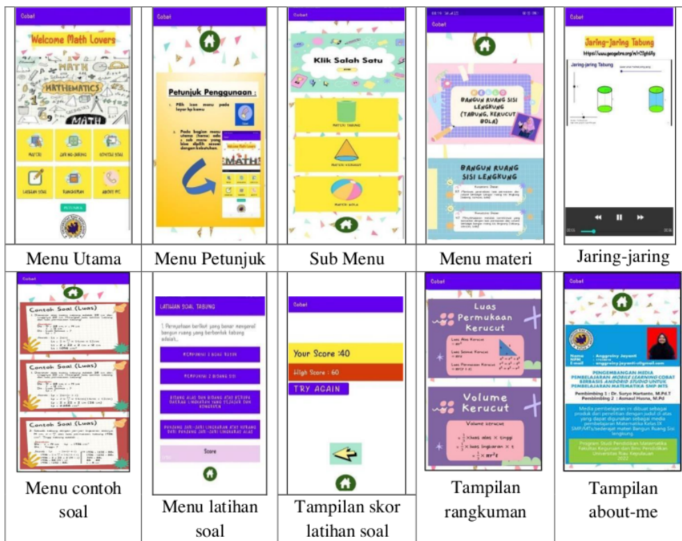
Gambar 2. Tampilan beberapa menu aplikasi

Tahap kedua adalah design (perancangan), peneliti melakukan beberapa kegiatan yaitu penyusunan tes acuan patokan, pemilihan media, pemilihan format, hingga pembuatan rancangan awal. Berdasarkan proses tersebut, dihasilkan kisi-kisi post-test . Peneliti memilih android studio sebagai program perancangan aplikasi dengan empat sumber referensi untuk pengembangan isi dari aplikasi. Peneliti telah menentukan alur aplikasi rancangan awal. Semua instrumen yang digunakan untuk keperluan penelitian sudah disiapkan pada tahap ini. Layout dan semua desain awal aplikasi telah disiapkan, sehingga rancangan awal aplikasi telah siap dikembangkan. Berikut beberapa gambar tampilan rancangan awal aplikasi.