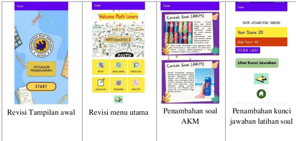
Gambar 4. Revisi aplikasi

Hasil uji coba validitas media menunjukkan bahwa media yang dikembangkan layak untuk digunakan sebagai media pembelajaran materi bangun ruang sisi lengkung kelas 9 SMP/MTs. Selanjutnya media telah siap untuk diujicobakan kepada peserta didik untuk dilaksanakan uji praktikalitas dan uji efektifitas. Namun, ada beberapa revisi dari ahli untuk perbaikan aplikasi sebelum diujicobakan pada peserta didik sebagai berikut: