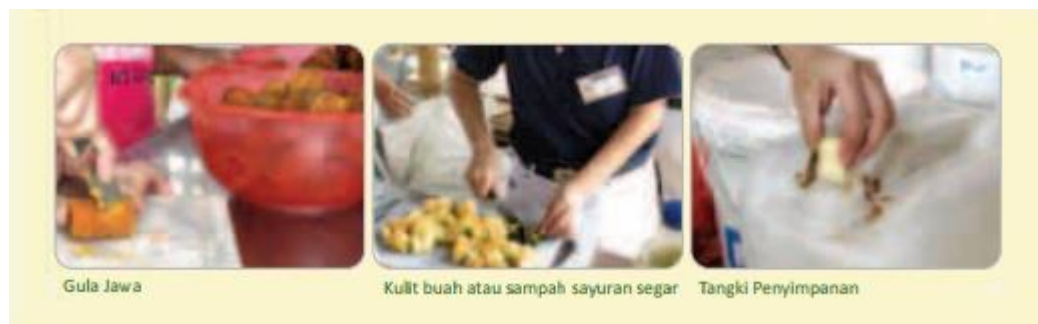
Gambar 1. Pembuatan Ekoenzim